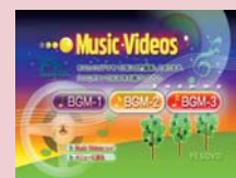
「Music Videos」 選択画面