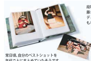
平日頃、自分のベストショットを年代ごとにまとめていたそうです。