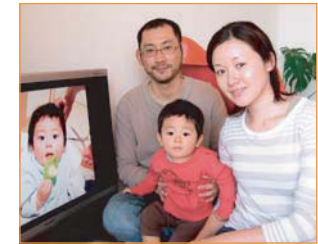
アルバムとは違ったカタチで思い出を残せて、主人も満足そうです。次は幼稚園の写真を考えてとのこと。

両親へ「ありがとう」の思いを込めて！ 誕生の頃から現在までの自分を、DVDアルバムとしてまとめました。来年、結婚が控えているので父親、母親へ、これまで育ててくれたことへの感謝の気持ちを伝えるような、何か特別なプレゼントをしたくて。すこし照れくさいですが、これを見たときの両親の喜ぶ（涙ぐむ？）顔が想像でき、今から楽しみです。婚約者である彼に出来上がったDVDを見せたら、「いい！」と思ったのでしよう。「二人が登場するバージョンを作って結婚式で流そう！」という話になり、一緒に写真を吟味中です。