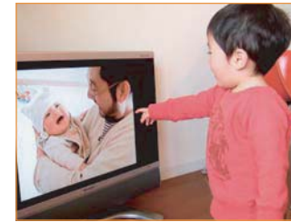
自分の赤ちゃんの時の写真に大喜び。ビデオより集中して見てました。