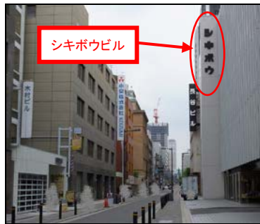
ふたすじ進むと、右手に敷島紡績(シキボウビル)があります。