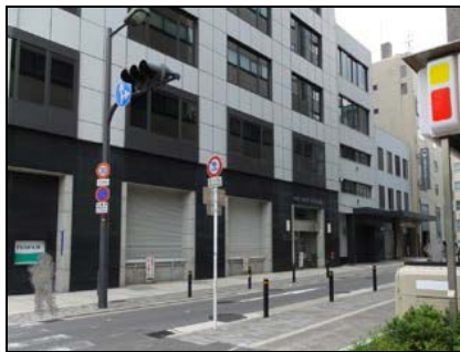
③の交差点を右に曲がります。