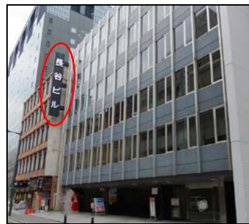
シキボウビルの隣が『長谷ビル』です。