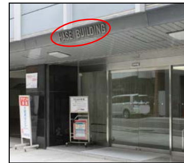
『長谷ビル』の 3 階が『大阪サービスステーション』です。