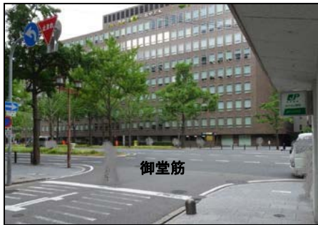
1 番出口を出て、右手の御堂筋(みどうすじ)に出ます。