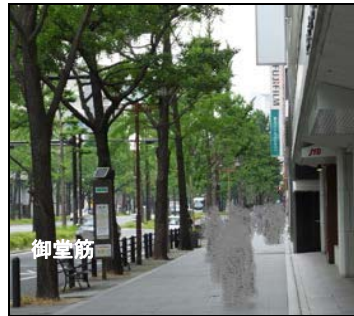
御堂筋を車の流れと反対(北)方向に進みます。