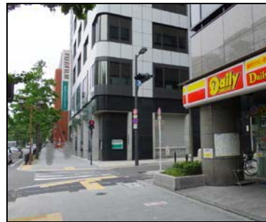
右手にコンビニ(H25.6.15 現在)のある交差点があります。